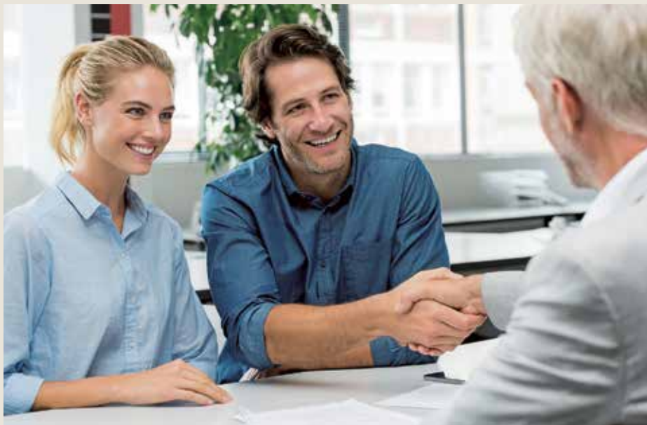
Anschlussfinanzierung Bauherren sollten hier rechtzeitig das Gespräch suchen

Anschlussfinanzierung All diese Themen sind für Hausbesitzer von großer Bedeutung. Vor allem die Anschlussfinanzierung in Zeiten steigender Zinsen macht Kunden Angst. Gerade hier lohnt sich