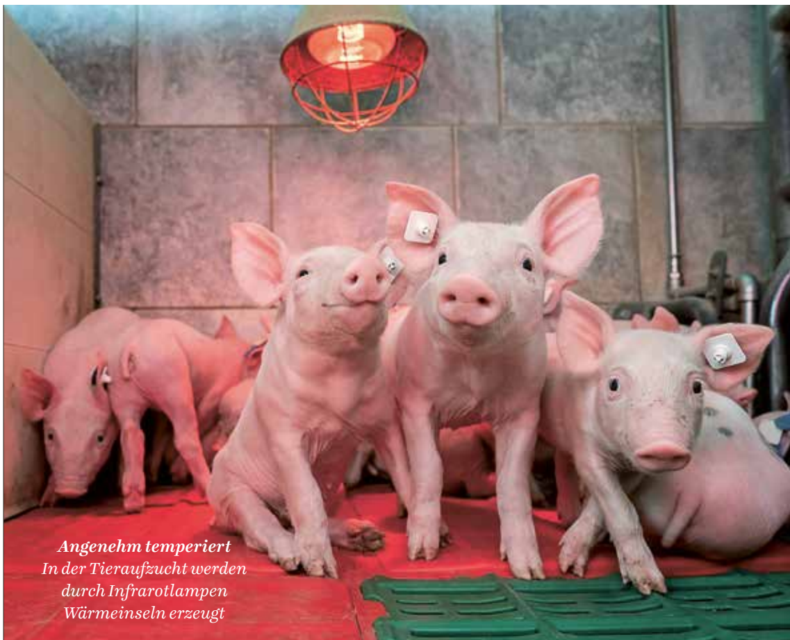
Angenehm temperiert In der Tieraufzucht werden durch Infrarotlampen Wärmeinseln erzeugt

Löschen Feuerlösch-Sprays in Dosen sind bei Preisen zwischen 20 und 30 Euro eine günstige Alternative zu den teuren und wartungsintensiven Feuerlöschern. Anders als Wasser können sie auch bei Fett- und Ölbränden eingesetzt werden.