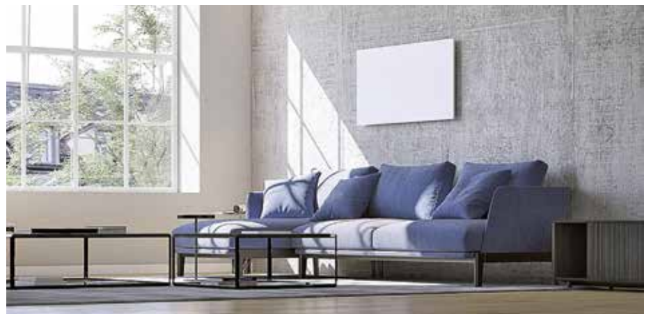
Wandheizung Dimplex IRM Infrarot-Metallheizung gibt es mit 320, 650, 800 oder 1000 Watt Leistung

Fazit Ob sich mit einer elektrischen Heizung in jedem Fall sparen lässt, darf bezweifelt werden. Bleibt der Trost, in Zukunft Strom aus Wind-, Wasserkraft oder Sonnenenergie zu nutzen. ■