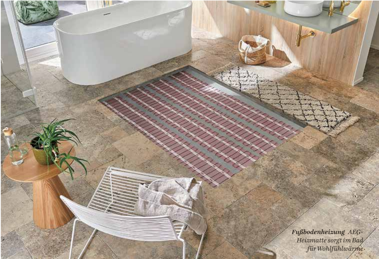
Fußbodenheizung AEG-Heizmatte sorgt im Bad für Wohlfühlwärme

Elektroheizgeräte können eine Gas- oder Ölzentralheizung ergänzen oder sogar ersetzen. Guter Rat Finance stellt fünf Möglichkeiten vor und sagt, was sie kosten